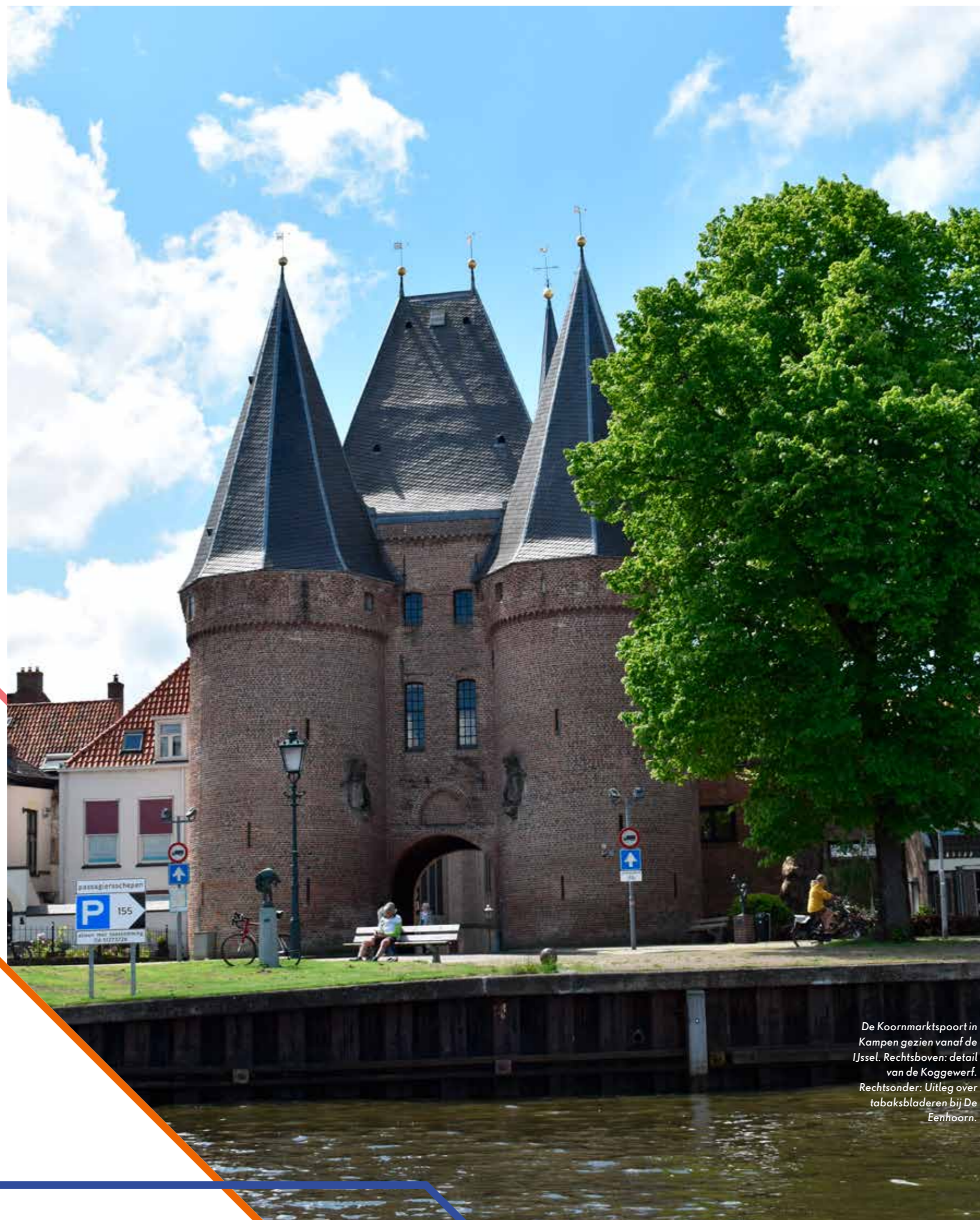
De Koornmarktspoort in Kampen gezien vanaf de IJssel. Rechtsboven: detail van de Koggewerf. Rechtsonder: Uitleg over tabaksbladeren bij De Eenhoorn.