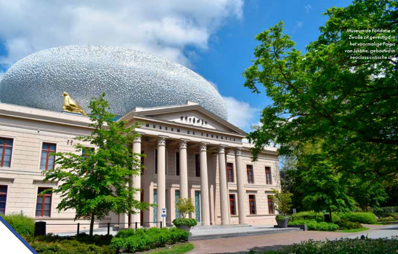
Museum de Fundatie in Zwolle zit gevestigd in het voormalige Paleis van Justitie, gebouwd in neoclassicistische stijl