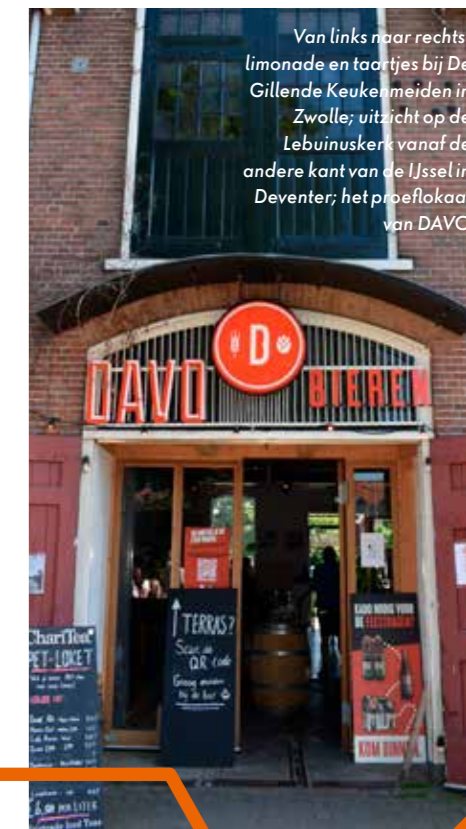
Van links naar rechts: limonade en taartjes bij De Gillende Keukenmeiden in Zwolle; uitzicht op de Lebuinuskkerk vanaf de andere kant van de IJssel in Deventer; het pilslokaal van DAVO