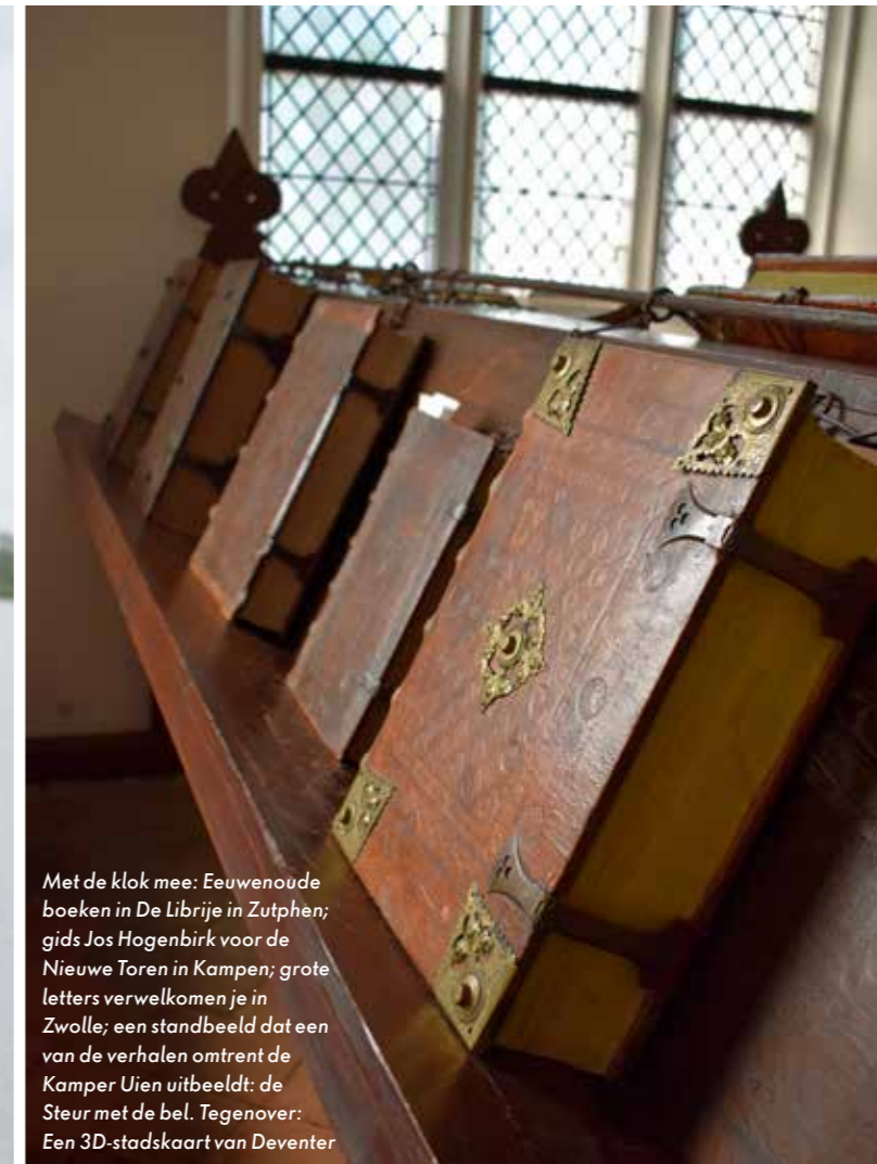
Met de klok mee: Eeuwenoude boeken in De Librije in Zutphen; gids Jos Hogenbirk voor de Nieuwe Toren in Kampen; grote letters verwelkomen je in Zwolle; een standbeeld dat een van de verhalen omtrent de Kamper Uien uitbeeldt: de Steur met de bel. Tegenover: Een 3D-stadskaart van Deventer